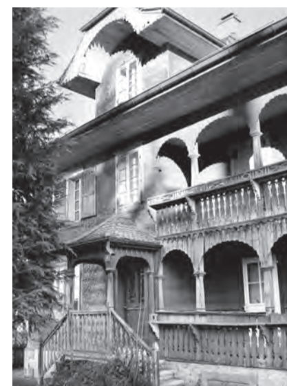
Die Pension Pfenniger an der Luzernerstrasse in den 1930er-Jahren.