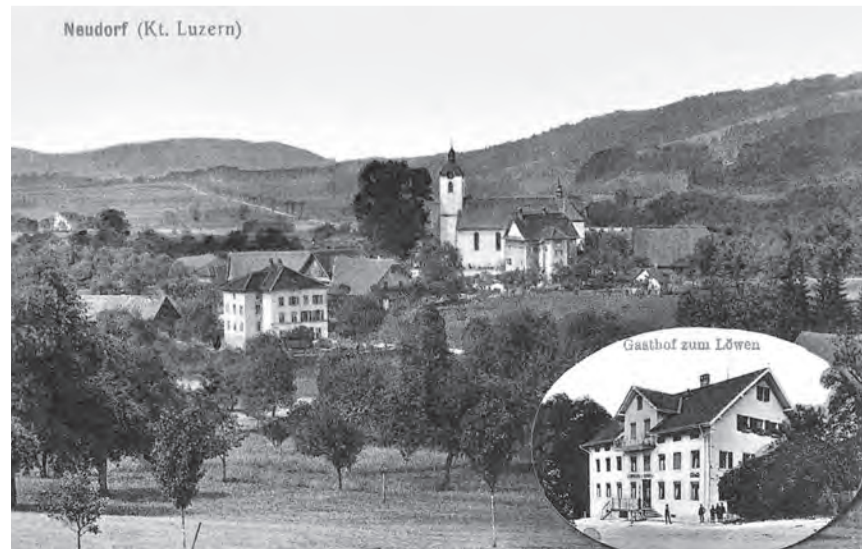
Ein überschaubarer Fleck: Neudorf im frühen 20. Jahrhundert auf einer Postkarte mit dem Löwen als Sujet.