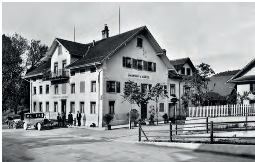
Das geschichtsträchtige Gasthaus zum Löwen im Herzen von Neudorf, Aufnahme um 1935.

Dem Gasthaus zum Löwen, welches einst den Reisenden der Postkutsche Unterkunft gab, gewährte die Regierung von Luzern besondere Privilegien. Dies, um diverse Gewerbe zu betreiben wie etwa Schnapsbrennen oder der Verkauf von Tabakwaren. Der Gasthof war auch über die Kantons Grenzen hinaus bekannt für seine guten Waadtländer Weine. Im Jahr