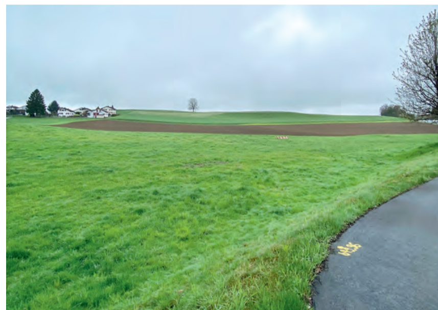
Grossprojekt Bifang Park kurz vor Baustart: In drei Wochen wird hier zum Spaten gegriffen.

Auch städtebaulich wird der Bifang Park das Gebiet prägen. Der neue Bau ist so konzipiert, dass er sich in die Topografie und den bestehenden Siedlungscharakter einfügt und gleichzeitig einen eigenständigen, zeitgemässen Akzent setzt. Zusam-